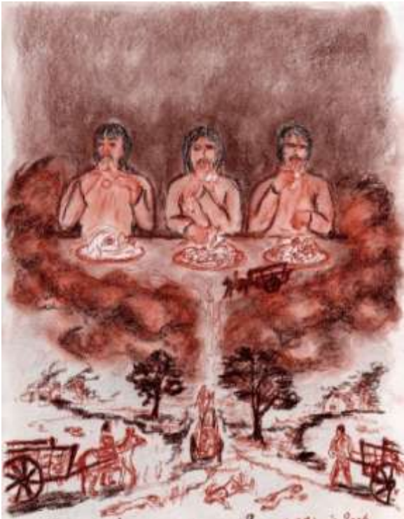
Yahvé, Jésus, Allah, Le banquet des 3 faux dieux